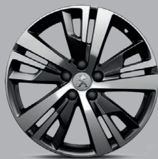
Leichtmetallfelge 18" „Detroit“, zweifarbig

Unterstreichen Sie den ganz eigenen Charakter Ihres PEUGEOT 3008 mit einer von insgesamt drei 1) verfügbaren Zwei-Ton-Leichtmetallfelgen in den Größen 18" oder 19".