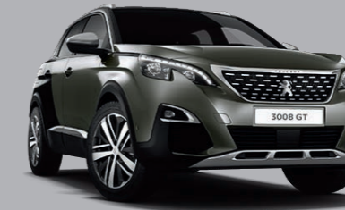
Amazonite Grau/Perla Nera Schwarz