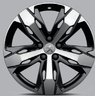
Leichtmetallfelge 18" „Los Angeles“, zweifarbig