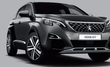
Platinum Grau/Perla Nera Schwarz