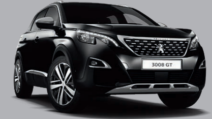
Perla Nera Schwarz