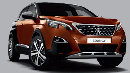
Copper Braun/Perla Nera Schwarz