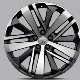
Leichtmetallfelge 19" „Boston“, zweifarbig