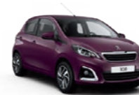
Red Purple Violet