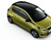
Green Fizz / Black Diamond