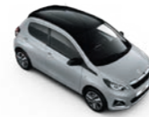
Gallium Grau / Black Diamond