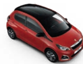
Scarlet Rot / Black Diamond