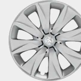
Radzierblende 15" „Brecola“ (1)