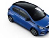
Calvi Blau / Black Diamond