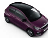
Red Purple Violet / Black Diamond