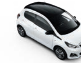
Lipizan Weiß / Black Diamond