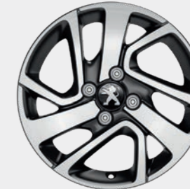
Leichtmetallfelge 15" „Thorren“ (2)