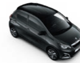
Carlinite Grau / Black Diamond