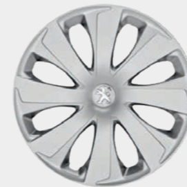
Radzierblende 14" „Xaurel“

1) Nur i. V. m. TOP! Active. 2) Sonderausstattung gegen Aufpreis.